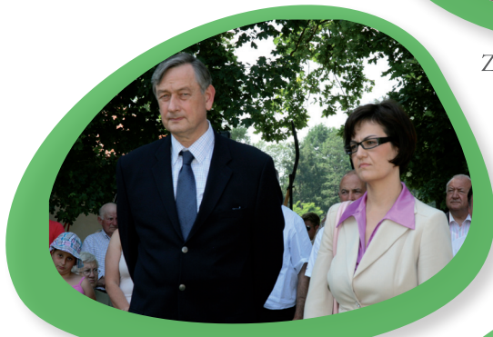
Predsednik dr. Danilo Türk v Ljutomeru.