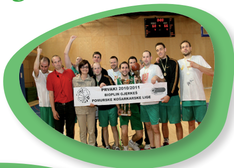
Finalni turnir pomurske košarkarske lige v Ljutomeru.