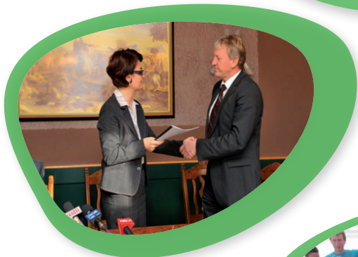
Podpis inženiring pogodbe za Sistem C.