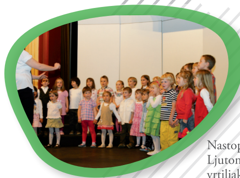
Nastop otrok iz vrtca Ljutomer – Mavrični vrtiljak.