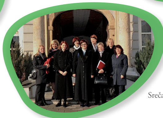
Srečanje slovenskih županj.