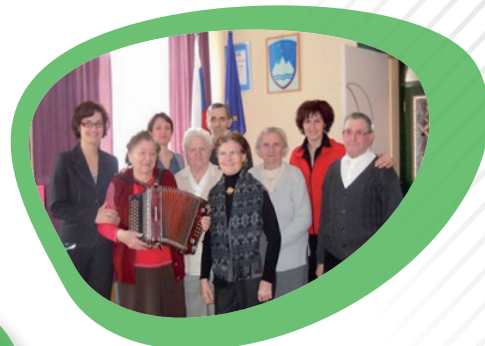
Sprejem skupine Beli Jorgovan iz Doma starejših občanov Ljutomer.