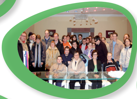
Sprejem varovancev VDC.