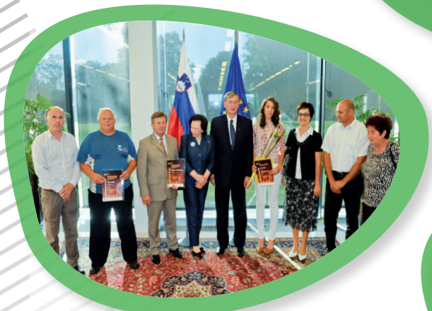
Sprejem Naj prostovoljcev na Brdu pri Kranju.